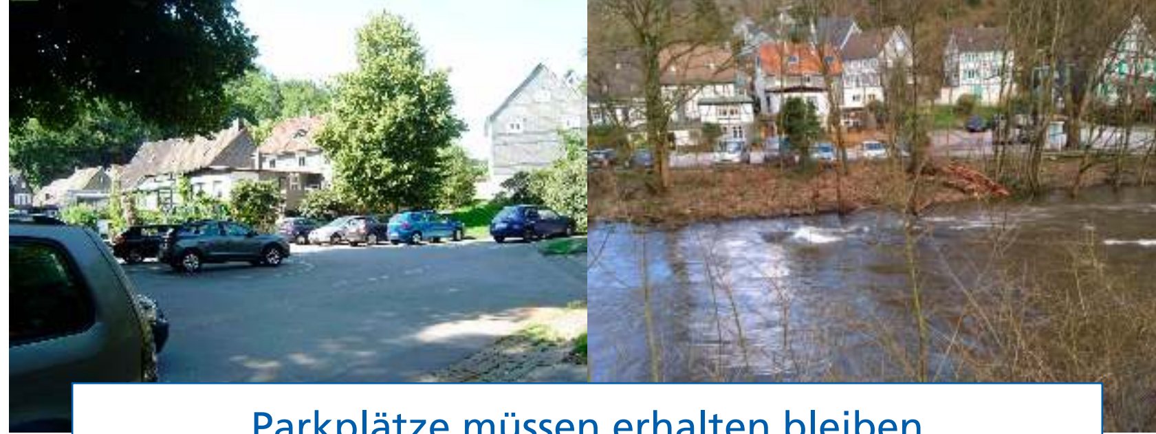
Parkplätze müssen erhalten bleiben der gesamte Parkplatz ist Überschwemmungsgebiet