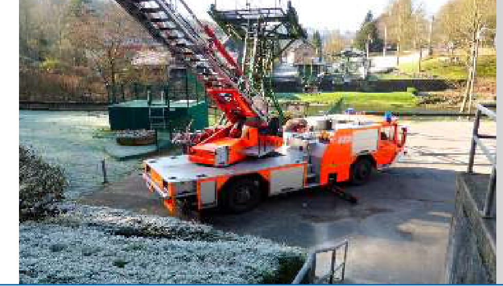
freizuhalten für Notfallrettung