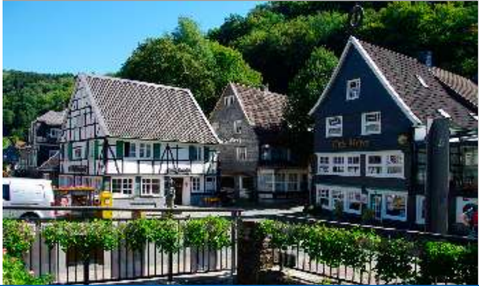
Gebäude stehen unter Denkmalschutz