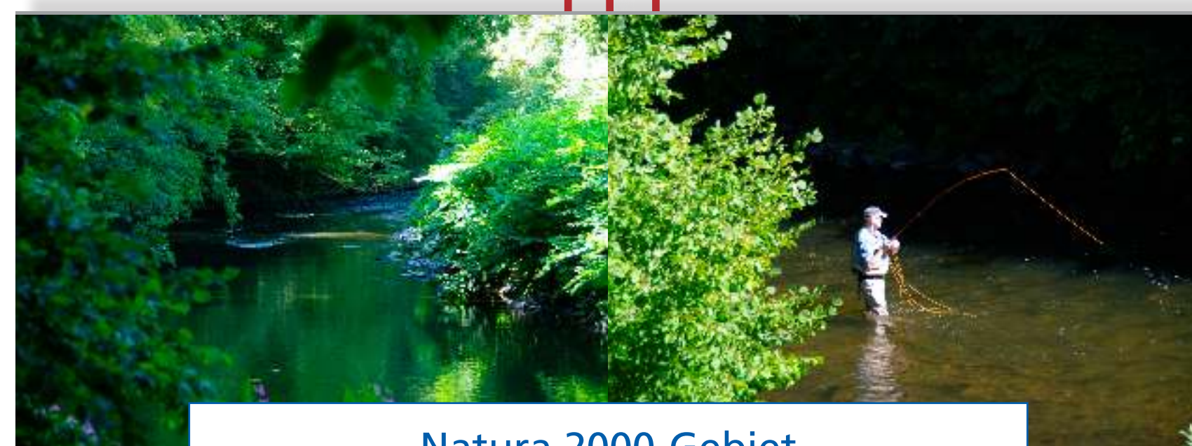
Natura 2000-Gebiet (besonderer Schutz von Fauna und Flora)